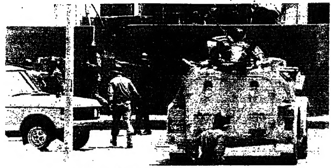
توزيع التقات أثناء عملية الاقتحام امس

قامت « الفرقة القتالية » التي الحقت بـ « الفرقة ١٦ » في بيروت باول عملية اقتحام امس ، استهدفت القوى على أشخاص أطلقوا النار على حاجز للشرطة في محلة الكرتينا واسابوا شرطيًا بجروح . وقد اشتركت بمهمة اقتحامها وصورتها مجموعة اسلحة ثقيلة وتم توقيف ستة أشخاص . ( التفاصيل على الصفحة ٤ )